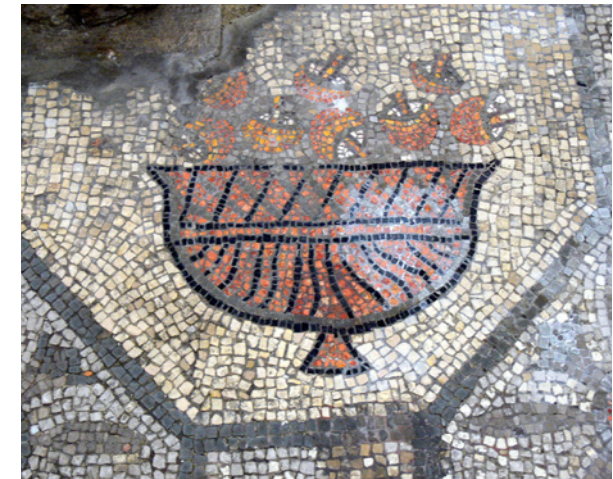
Fußbodenmosaik aus der Basilika von Aquileia (1. H. 4. Jh. n. Chr.)

Referent: Prof. Dr. Gregor Weber (Augsburg)